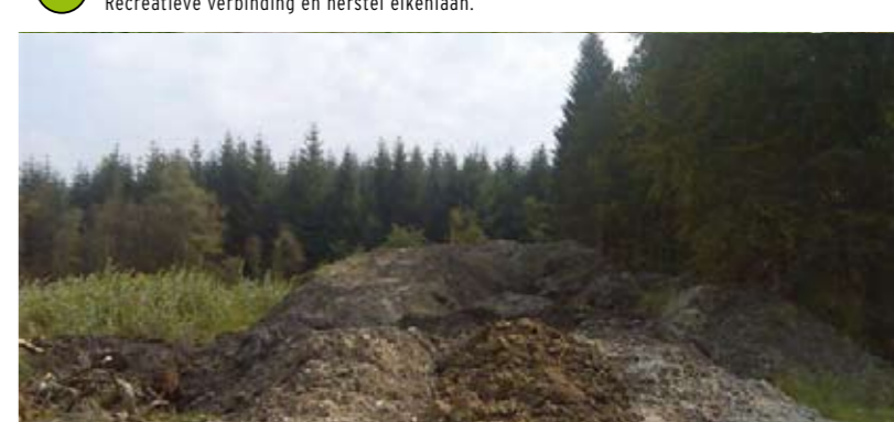
22 Ecologische verbindingzone De Slokkert Brede, natte verbindingzone tussen Fochteloërveen en de bovenloop van De Slokkert.