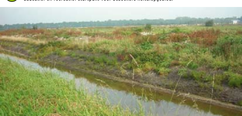
8 Ecologische verbindingzones Ter Borgh Recreatieve en ecologische verbinding tussen woonwijk en Eelder- en Peizermaden.