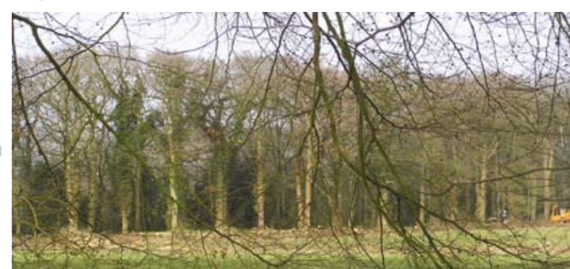
12 Herstelplan Huis te Glimmen Behoud en versterking landgoed als natuurlijk, historisch parklandschap.