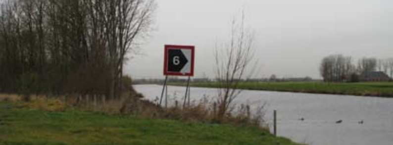
5 Fietsbrug Aduarderdiep Belangrijkste schakel recreatieve ontsluiting Groningen-Westerkwartier.