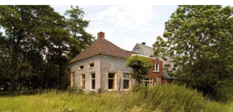
7 Toekomstig bezoekerscentrum Reitdiep Educatief en recreatief startpunt voor bezoekers Reitdiepgebied.