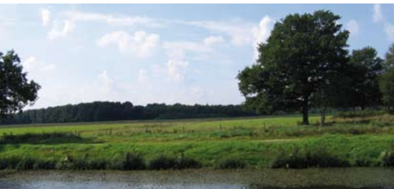
10 Toegangspoort Noord Recreatief startpunt voor bezoekers nationaal landschap Drentsche Aa.