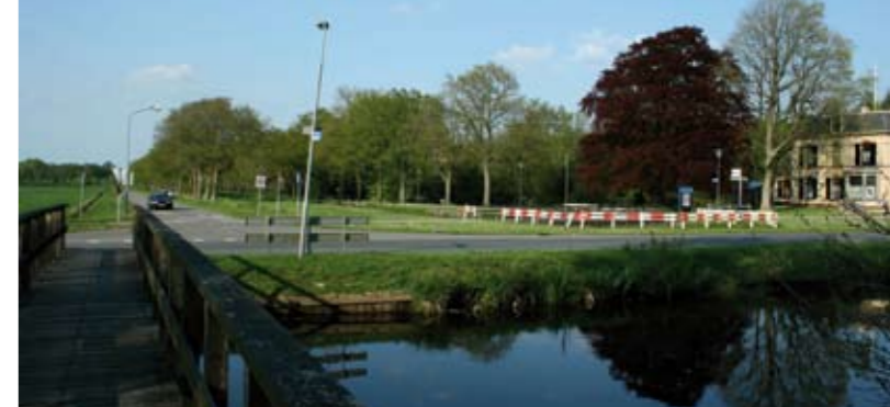
11 Fietspaden Veenhuizen en Fochteloërveen Recreatieve schakels voor fietsrondje.