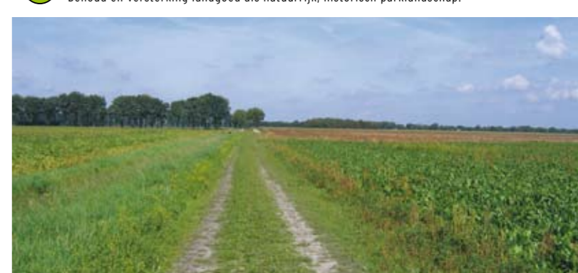
18 Oude schoolpad Zeijen Recreatieve verbinding en herstel eikenlaan.