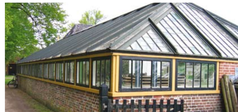
23 Fraylemaborg, levende historie Nieuwe kansen voor recreatie en toerisme op basis van kwaliteiten borg, borgtuin en bospark.