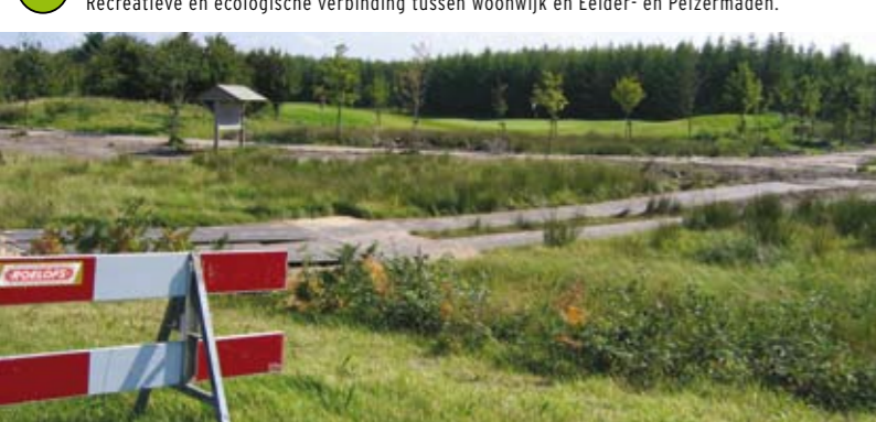
9 Arboretum Assen Recreatieve voorziening en fietsrondje in nieuw uitlooppgebied Assen.